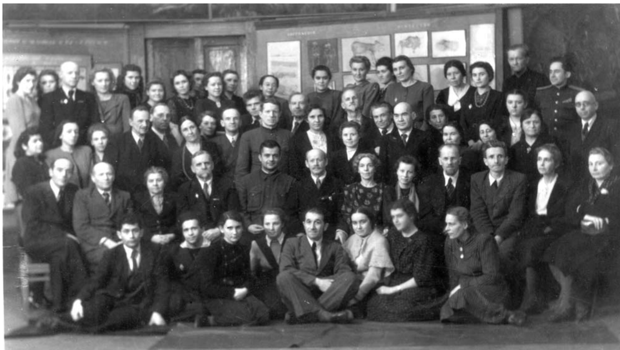
Илл. 2. Торжественное заседание коллектива антропологов, посвященное чествованию профессора М.А. Гремяцкого в связи с 60-летием со дня его рождения. 14 декабря 1947 г.

по разработке инструкций для антропометрических исследований, ведущихся в учреждениях Наркомздрава, Главсанупра, Наркомтруда и других государственных подразделениях.